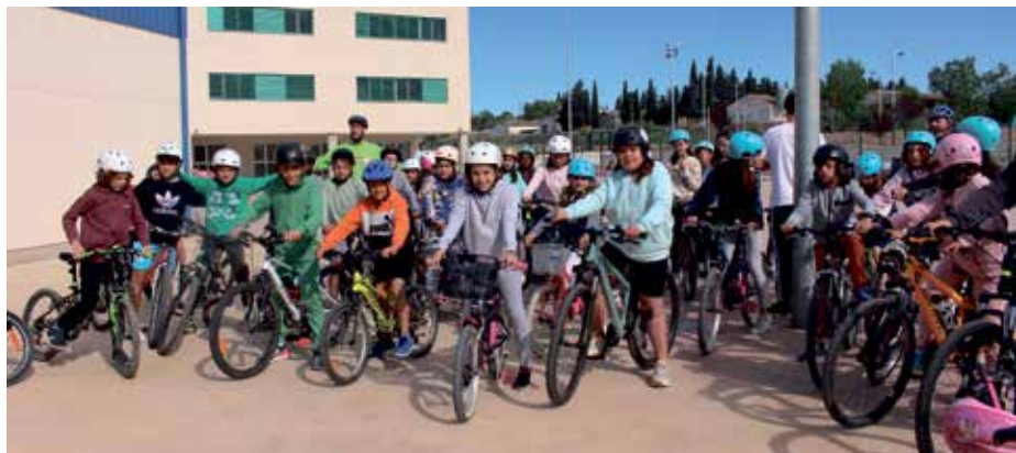
Los alumnos del CEIP Katia Acín, preparados para las prácticas en el parque Los Olmos.

Aprender a circular por las calzadas, respetando señales, peatones y demás vehículos es imprescindible para la seguridad de los niños y niñas que empiezan a desplazarse en bicicleta por el ámbito urbano. Este es el principal objetivo del Aula en Bici que promueve el Ayuntamiento de Binéfar en colaboración con los centros escolares de educación Primaria de la localidad, en concreto los CEIP Víctor Mendoza y Katia Acín y el colegio Virgen del Romeral.