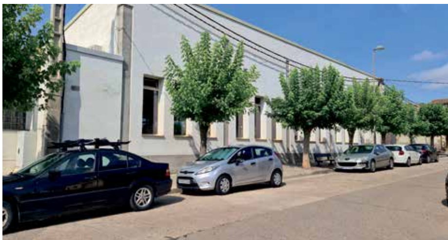
🕒 Pabellón del CDM El Segalar junto al que está previsto construir el nuevo edificio.

La financiación de una parte de la ejecución de esta instalación deportiva la asumen durante el ejercicio 2023, y de acuerdo con lo estipulado en el convenio de colaboración, entre la Comunidad Autónoma de Aragón y el Ayuntamiento de Binéfar. El Departamento de Educación aportará 300.000 euros mientras que el ayuntamiento se compromete a la ejecución de las obras. La ejecución completa del pabellón deportivo está prevista en dos ejercicios, ascendiendo en su totalidad a 1.909.258,24 euros. El nuevo pabellón irá destinado para la práctica de baloncesto, fútbol sala, voleibol, bádmiton y otras actividades y otros deportes de sala, y contará con los espacios auxiliares necesarios para su uso: aseos, almacén y salas de instalación técnica.