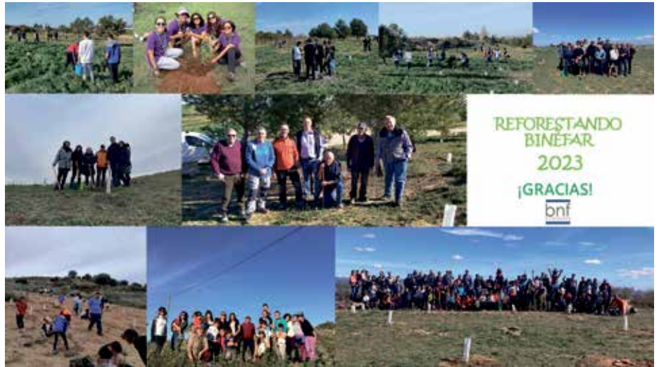
🕒 Grupos que han participado en la campaña de reforestación 2023.

La campaña de reforestación de comunales que anualmente organiza el Ayuntamiento de Binéfar, a través del área de Medio Ambiente, se cerró este año con la participación de más de 500 personas, la mayoría en grupos de amigos, familia o asociaciones. Durante los meses de febrero y marzo, se plantaron cientos de nuevos árboles que ahora habrá que cuidar, sobre todo regándolos para que no mueran por el calor veraniego. El Ayuntamiento agradece la colaboración de tantos voluntarios, así como de la DPH que suministró algunas plantas y materiales.