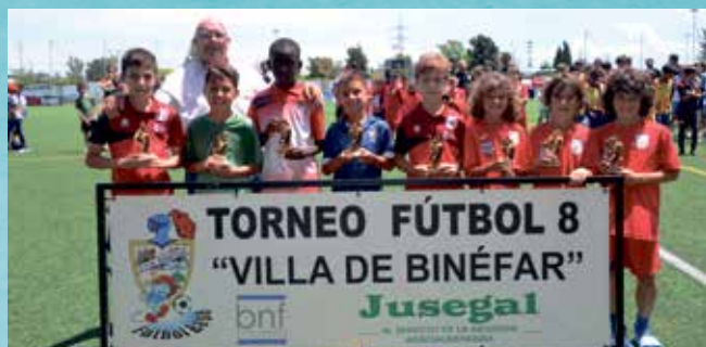
Mejor 8 benjamín.

Espléndida jornada deportiva la vivida en Binéfar el fin de semana del 10 y 11 de junio en el XXV Torneo de Fútbol 8 Villa de Binéfar, que reunió a 320 niños, más acompañantes. El torneo lo disputaron veinte equipos, diez benjamines y diez alevines, de distintas localidades, entre las que se contaba Portet sur Garonne, que aportó dos equipos